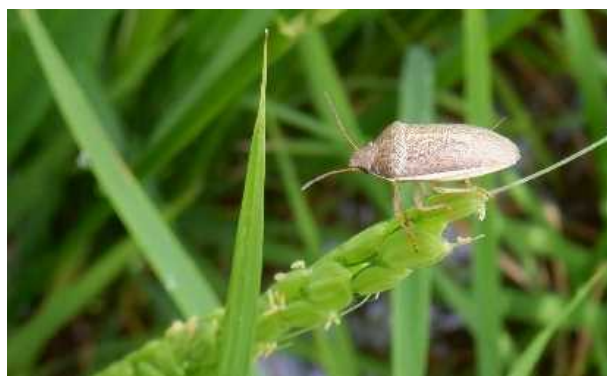
写真 稲の穂を吸汁加害するイネカメムシ成虫

これにより、品質が低下したり収穫量が低下することが問題となっています。今回はこの虫を対象として、ドローンを利用した殺虫剤散布による防除を行いました。