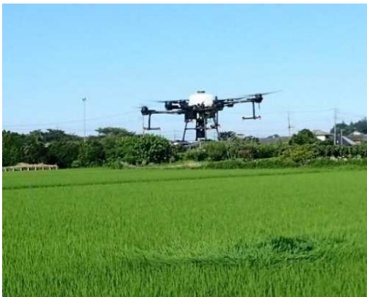
図1 ドローンによる追肥作業の様子